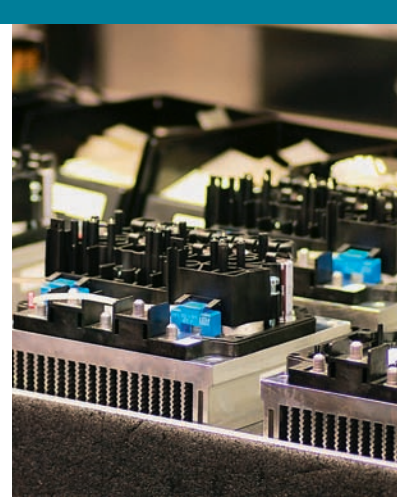
Viel Automatik – aber auch Handarbeit in der Fertigung von Halbleitern bei Semikron in Nürnberg