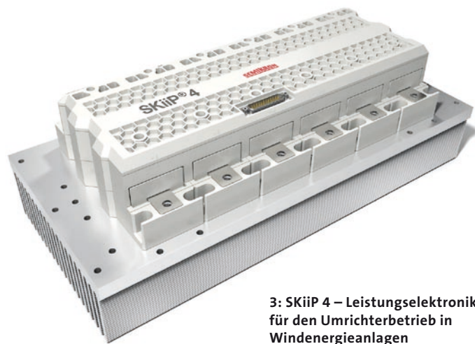
3: SKiIP 4 – Leistungselektronik für den Umrichterbetrieb in Windenergieanlagen

Von den bis Ende 2009 weltweit installierten Windenergieanlagen mit 122 GW Leistung sind rund 57 GW mit Lösungen von Semikron ausgestattet. Der Anbieter von Leistungselektronik in der Windenergie beschränkt seine langjährige Erfahrung aber nicht auf die blanke Ausstattung der Anlagen mit seinen Power Modulen der mittlerweile 4. Generation (Bild 3). Bereits beim Design einer neuen Anlage wird Hilfestellung in Form von Erfahrung und Synergieeffekten geleistet. Auch die Beratung zu Sicherheitskonzepten, wie z. B. für Überstrom